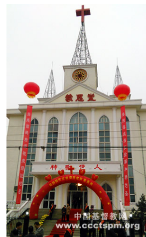
Oct. 22, Taigu County, Shanxi Province