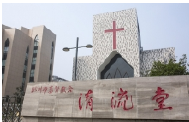
Nov. 26, Chuzhou Church. Anhui province