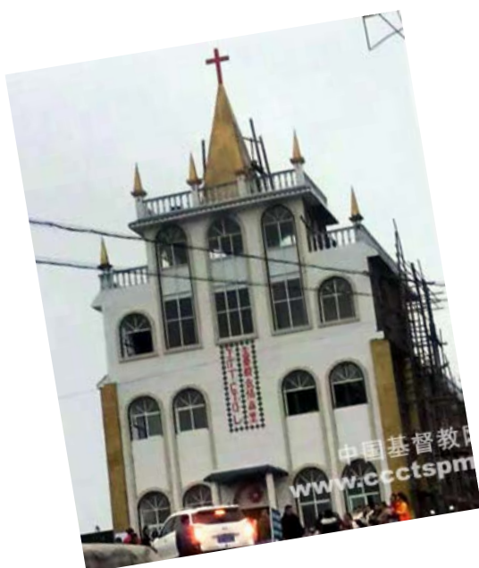
Nov. 29, a new church in Yinjin County, Yunnan Province