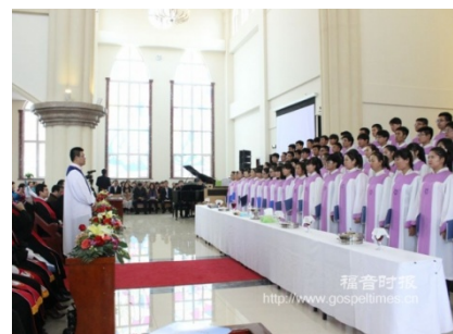
Oct. 20, New church in Northeast theological seminary